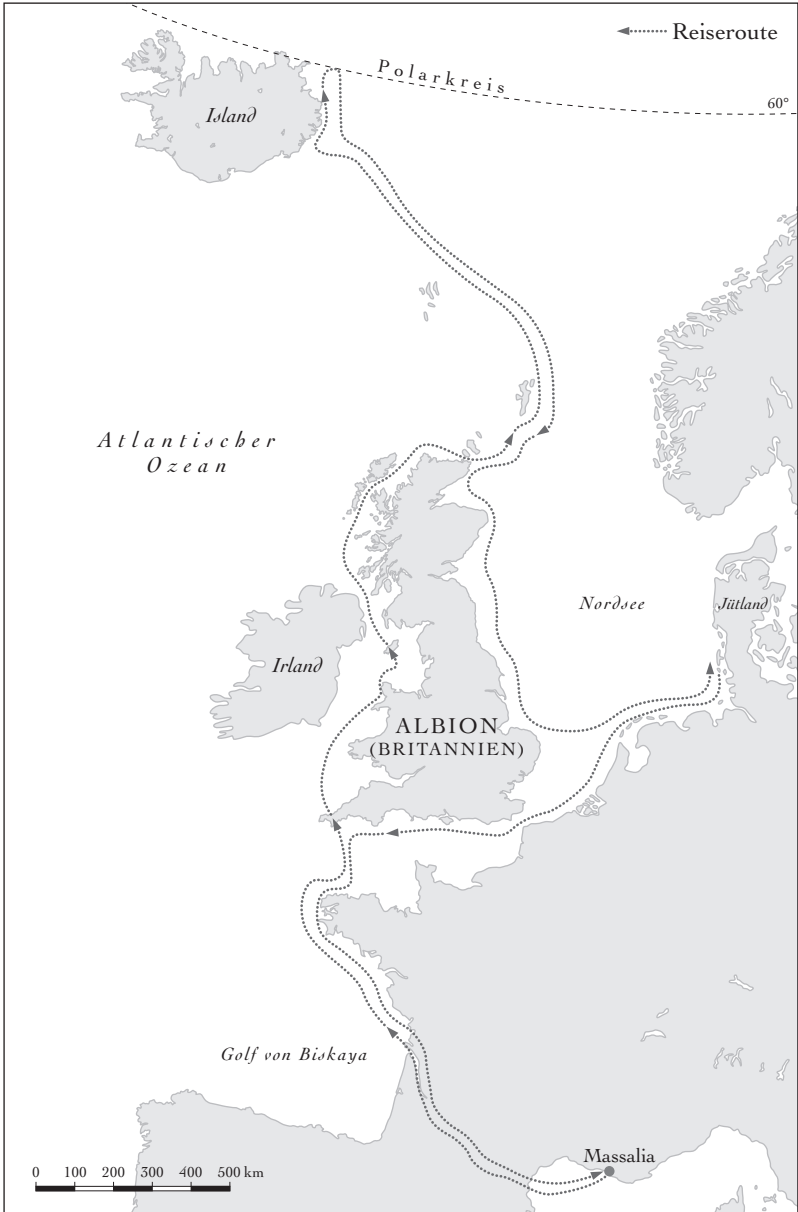
Karte 2: Die Reisen des Pytheas