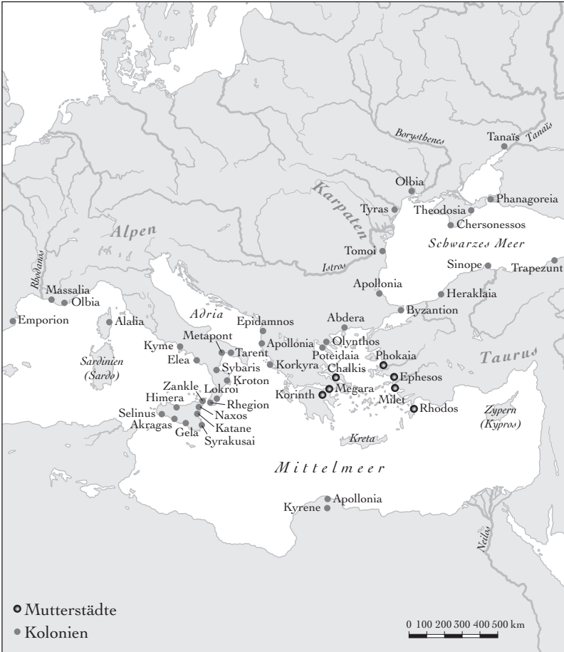
Karte 1: Griechische Auswanderung