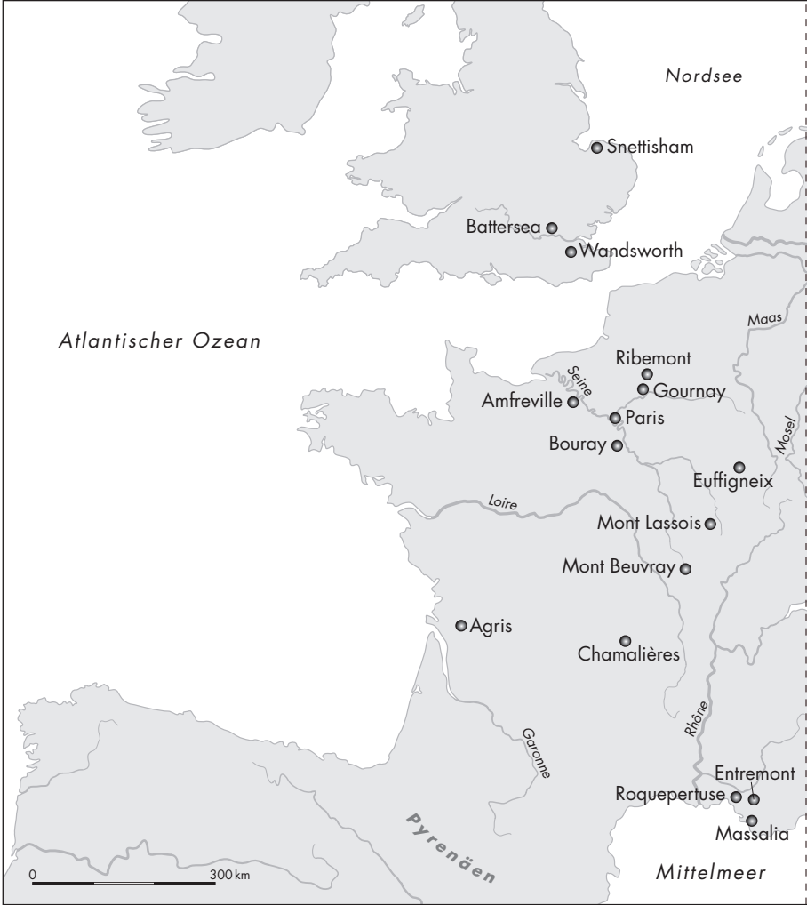
Keltische Fundstätten in Mitteleuropa

halb größerer Siedlungen noch weitgehend unberührt. Ein ausgebautes Straßen- und Wegenetz fehlte, zumal man sich für den Transport von Handelsgütern überwiegend der natürlichen Wasserstraßen bediente. Bäche und Flüsse waren nirgendwo reguliert, und ausgedehnte Wälder beherbergten eine Vielfalt von Tierarten. Die Mobilität des Großteils der Bevölkerung war zweifellos gering, so dass sich das Leben der