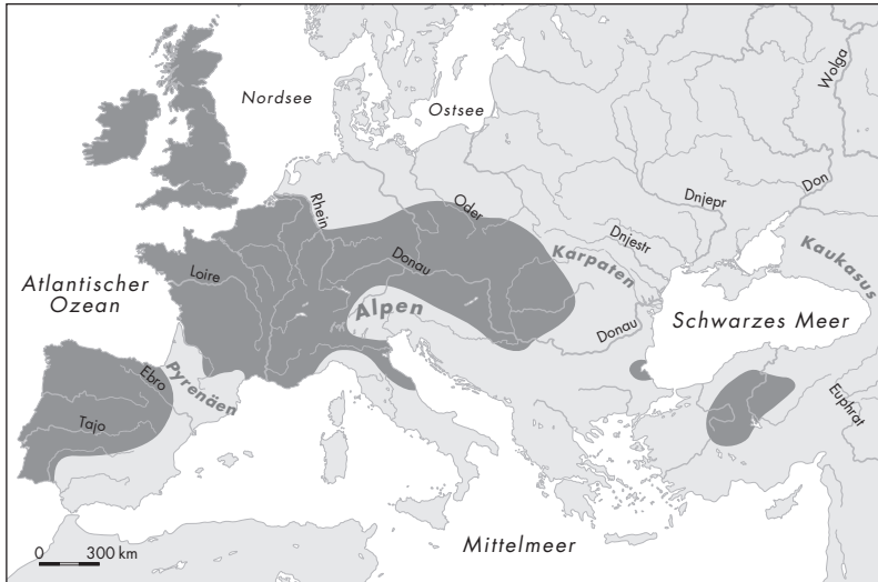
Mutmaßliches Verbreitungsgebiet der keltischen Sprachen zur Zeit ihrer größten Ausdehnung im 2./1. Jahrhundert v. Chr.

Im Unterschied zum diffusen Keltenbegriff der Antike bezieht sich «Keltisch» in der zu Beginn des 19. Jahrhunderts entstandenen vergleichenden Sprachwissenschaft ausschließlich auf sprachliche Gegebenheiten. 7 Dazu muss man allerdings wissen, dass die Kelten des europäischen Festlands und Kleinasien ihre Sprache bis zum Ausgang der Antike gegen das Lateinische bzw. Griechische eingetauscht hatten und mit dem Übergang zum Mittelalter auch die Kenntnis des historischen Zusammenhangs zwischen den Idiomen der antiken Kelten und den Sprachen der Iren, Hochlandschotten, Waliser und Bretonen verloren gegangen war. Erst der schottische Humanist George Buchanan (1506–1582) entdeckte diesen Zusammenhang wieder von Neuem, und erst seit dem 18. Jahrhundert setzte sich dann der Name «Keltisch» als Oberbegriff zur Bezeichnung sowohl der Sprache der antiken Kelten als auch der alteingesessenen Sprachen von Irland, Schottland, Wales und der Bretagne allgemein durch. Starken Auftrieb erfuhr die Beschäftigung mit den nunmehr sogenannten keltischen Sprachen seit der Mitte des 19. Jahrhunderts nach der Entdeckung der indogermanischen Spracheinheit durch Sir William Jones (1746–1794), besonders nachdem man in den 1830er Jahren die Zugehörigkeit der in mancher Hinsicht eigentüm-