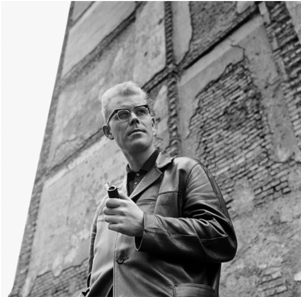
Die Fotos wurden von Digne Meller Marcovicz in dieser Anordnung zusammengestellt für ihr Buch »... die Lebendigen und die Toten ...«.