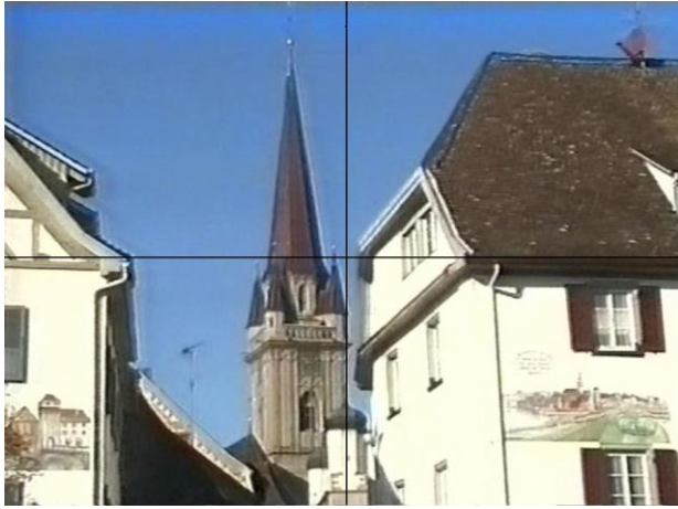
Abbildung 6: Kriegerdenkmal (Raab 2008, S. 191)