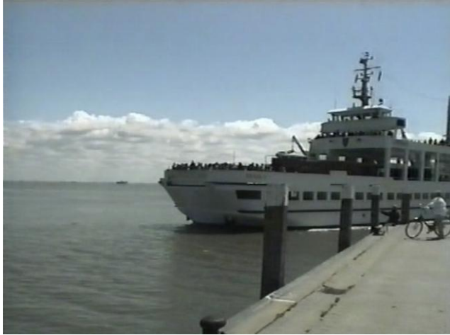
Abbildung 3: Juist I (Raab 2008, S. 172)

Die Abbildungen 3 und 4 entstammen verschiedenen Filmen, die zudem von unterschiedlichen Akteuren produziert wurden. Beide Filme entstanden jedoch im Jahre 2000, beide Akteure gehören demselben Videoamateurclub an, und beide Abbildungen zeigen das jeweils erste Realbild der Handlungsprodukte. Wiederum wurden die Fälle nach dem Prinzip der maximalen Kontrastierung ausgewählt. Abbildung 3 eröffnet einen mit „Juist – die etwas andere Ferien-Insel“ betitelten Film, dessen Produzent ein ausgesprochenes Faible für Reisedokumentationen, Familien- und Tieraufnahmen hat, und der als zum Zeitpunkt der Erhebung fast 70-Jähriger zu den ältesten Mitgliedern des Clubs gehört. Abbildung 4 steht am Anfang des Filmes „Kriegerdenkmal“. Der Filmer ist Grundschullehrer, mit Mitte 40 das jüngste Clubmitglied und hat eine Präferenz für kritische Lokalreportagen über Sport, Kultur und Politik.