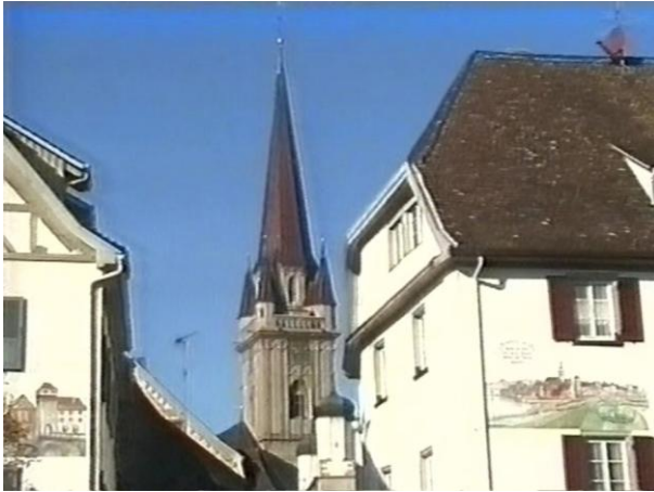
Abbildung 4: Kriegerdenkmal (Raab 2008, S. 191)

Beide Akteure bekleiden eine im Club hoch angesehen soziale Position, denn sie sind so genannte Vielfilmer. Bereits mehrfach erhielten sie den clubinternen Wanderpokal für den höchsten Filmausstoß, was sie zu Konkurrenten macht, die auch persönliche Aversionen gegeneinander hegen. Konkurrenten sind sie aber auch, weil der Club für die Teilnahme an regionalen und überregionalen Wettbewerben stets nur eine begrenzte Anzahl von Filmen auswählt. Das dahingehende Betrachten und Diskutieren der Filme geschieht an den wöchentlichen Clubabenden, an denen auch prämierte Produktionen des eigenen und anderer Clubs geschaut und wiederholten Diskussionen und Bewertungen unterzogen werden. Völlig frei sind die Clubfilmer in der Wahl ihrer Themen, welche auch niemals als solche zum Gegenstand gruppeninterner Diskussionen werden, denn scharf diskutiert wird einzig die Form der filmischen Realisierung. Bereits dieser Umstand deutet darauf hin, dass sich die ‚Signatur des Clubs‘ nicht im Was , also in den vermittelten Inhalten, als vielmehr im Wie , nämlich in der Bauform der medialen Handlungsprodukte zu erkennen gibt.