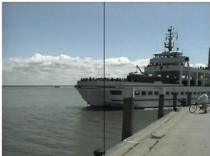
Abbildung 5: Juist 1 (Raab 2008, S. 172)

Die Sehgemeinschaft konstituiert sich über die fortlaufende Aktualisierung und wechselseitige Vor-Augen-Führung ihres Schnittmusters. Denn ist das Muster in den Handlungsprodukten umgesetzt und stimmen die zur Ansicht kommenden Inszenierungen mit den Kompositionsidealen und den Bildwünschen der Clubmitglieder überein, dann sind diese vom Kollektiv als erfolgreich bewerteten Filme sichtbare Vergegenständlichungen seines eigenen Seinsollens: idealisierte Ausgestaltungen von Wirklichkeiten, wie sie sich nur im technischen Artefakt entfalten können. Somit geben die Handlungsprodukte Auskunft über die Weltsicht und das Selbstbild der Sehgemeinschaft; darüber, wie diese im Idealfalle sehen und aussehen soll, ebenso wie über die Konstruktionsbedingungen dieser Wirklichkeiten, denen in letzter Instanz auch die Gemeinschaft selbst unterliegt.