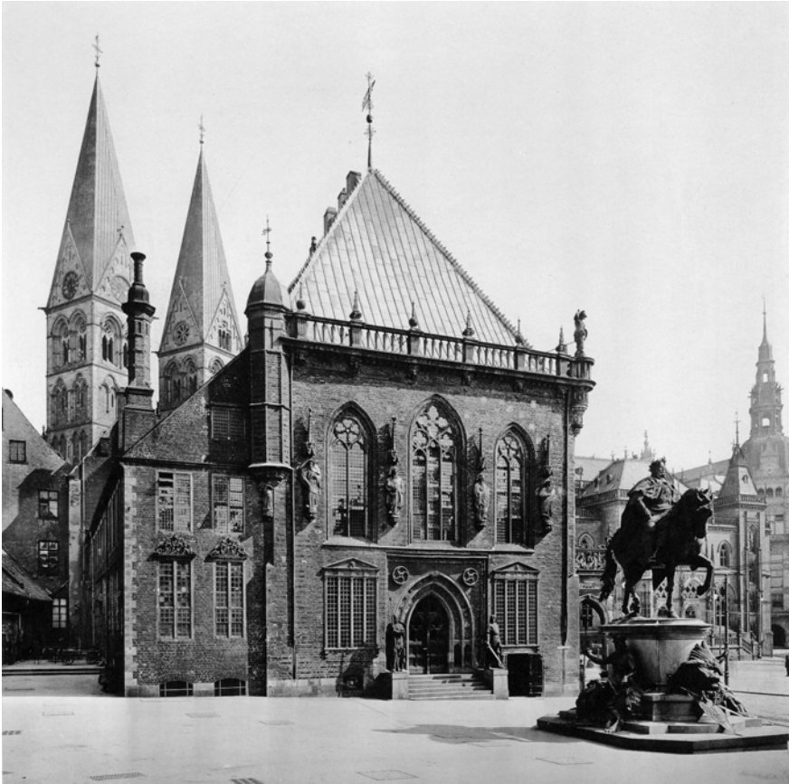
Abb. 2: Die Westfassade des Bremer Rathauses 1907 mit Robert Bärwalds Reiterdenkmal für Kaiser Wilhelm I. von 1893. Rechts neben dem Westportal mit den »Rittern« von Rudolf Maison (1903) der Eingang zum Ratskeller.

waren die deutschen Herrscher erstmals nicht nur symbolisch, sondern ganz real in Bremen angekommen. 49