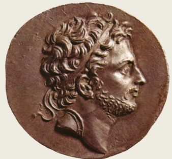
König Perseus (179–168 v. Chr.)