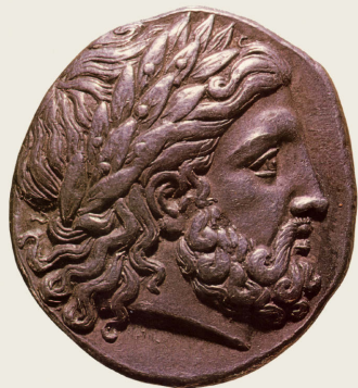
Kopf des Zeus mit Eichenlaub