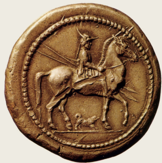
Alexander I., makedonischer König (5. Jh. v. Chr.)

Den Plan eines Feldzuges gegen die Perser konnte er allerdings nicht mehr in die Tat