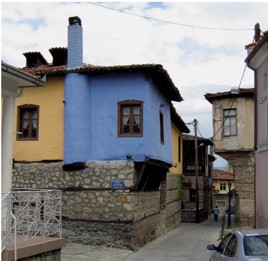
Pittoreske Gasse in der Altstadt von Beroia (Véria)

Mit Hilfe von Exkursen werden wir uns gelegentlich auch das weitere Umfeld der paulinischen Missionsreisen erschließen und damit Stätten miteinbeziehen, die nicht direkt auf dem Weg des Apostels lagen, aber den kulturellen und geschichtlichen Hintergrund des frühen Christentums beleuchten. Aus diesem Grunde sind in diesem »Biblischen Reiseführer« neben den paulinischen Städten auch Pella und Vergina (Aigai) sowie Eleusis, Epidauros, Delphi und Olympia aufgenommen.