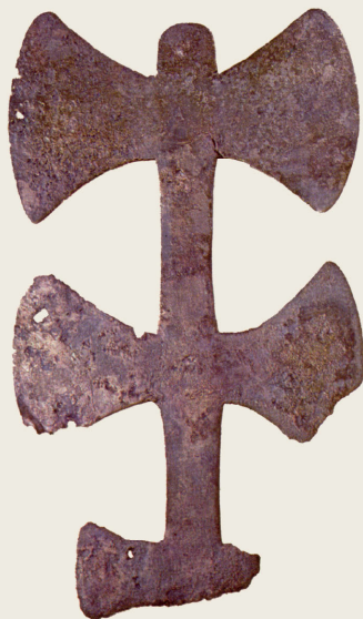
Doppelaxt um 900 v. Chr. (Vergina)