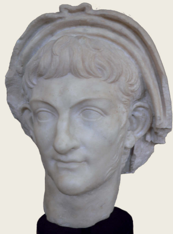
Kaiser Nero, 54–68 n. Chr. (Korinth, Archäologisches Museum)

Die zunehmenden Spannungen innerhalb der von Kaiser Diokletian (284–305 n. Chr.) eingeführten Tetrarchie (»Vierkaisertum«) führten schließlich zur Spaltung des Römischen Reiches in einen westlichen und einen östlichen Teil. Das Jahr 395 n. Chr. gilt als das Datum der Reichsteilung des inzwischen christlich gewordenen Imperiums. Griechenland gehörte von da