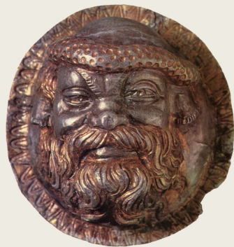
Kopf eines Satyrn – lüstern und bockbeinig dargestellte Satyrn gehörten zum Gefolge des Gottes Dionysos

Weitere fremde Kulte gelangten durch den Übergang in die römische Herrschaft nach Griechenland. So findet man beispielsweise im 1. Jh. n. Chr. in Philippi den Kult des Silvanus, eine ursprünglich nur in Italien verehrte Waldgottheit. Auch der Kaiserkult hielt in dieser Zeit Einzug in Griechenland und darüber hinaus im gesamten römischen Osten. Allen diesen Kulturen gemeinsam war, dass sie keineswegs Exklusivität beanspruchten. Die »Gläubigen« konnten regelmäßig am Kaiserkult teilnehmen, ohne ihre Mitgliedschaft im Verein zur Verehrung des Dionysos kündigen zu müssen. Allein das zeigt, wie liberal und pluralistisch die religiöse Einstellung in der griechisch-römischen Antike war. Als sich dann im 3./4. Jh. n. Chr. das Christentum anschickte, zur bestimmenden Religion im Römischen Reich zu werden, musste sich dieses allerdings ändern. Nach und nach wurden die heidnischen Kulte verdrängt oder verboten, ihre Tempel nicht selten in christliche Kirchen umgewandelt. Doch bevor es so weit war, sollte das Christentum noch einen langen Weg durchschreiten. Und dieser begann in der Mitte des 1. Jh. n. Chr. mit den Missionsreisen des Apostels Paulus.