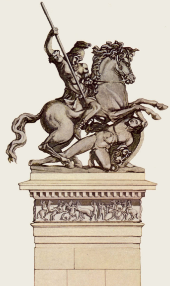
Denkmal in Delphi für den Sieg der Römer 168 v. Chr. (Rekonstruktion)

Aber der zweite Krieg gegen die Römer ging verloren (200–197 v. Chr.) und führte faktisch zum Verlust der Souveränität und jeglichen Einflusses in Griechenland. 196 v. Chr. verkündete der römische General Titus Quinctius Flamininus die Freiheit Griechenlands, deren Schutzmacht nun Rom wurde. Daran änderte auch das letzte Aufbäumen der Makedonen unter ihrem König Perseus (179–168 v. Chr.) nichts. Nach der Schlacht bei Pydna 168 v. Chr. war das Schicksal Makedoniens besiegelt. Das Königreich wurde zerstükkelt und in vier unabhängige Verwaltungsbezirke aufgeteilt (μερίδες).