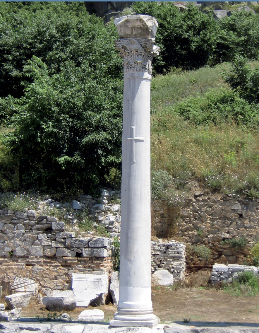
Säule der Basilika A in Philippi