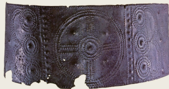
Bronze-Diadem um 900 v. Chr. (Vergina)

Innenpolitisch entwickeln sich in den Stadtstaaten des griechischen Mutterlandes schon bald Ansätze zu demokratischen Staatsformen, die – wie im Fall Athens – den Bürgern (nicht den Sklaven und Frauen) eine Teilnahme an den politischen Entscheidungen ihres Gemeinwesens ermöglichen ( klassische Zeit ca. 550–350 v. Chr.).