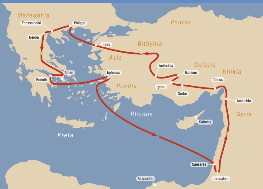
Die 2. Missionsreise: von Antiochia in Syrien nach Griechenland und zurück