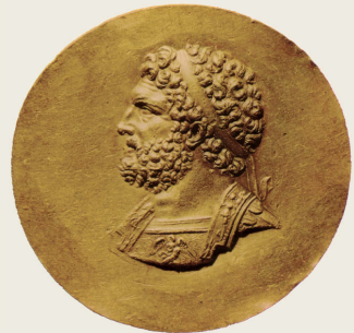
König Philipp II. (356–336 v. Chr.)