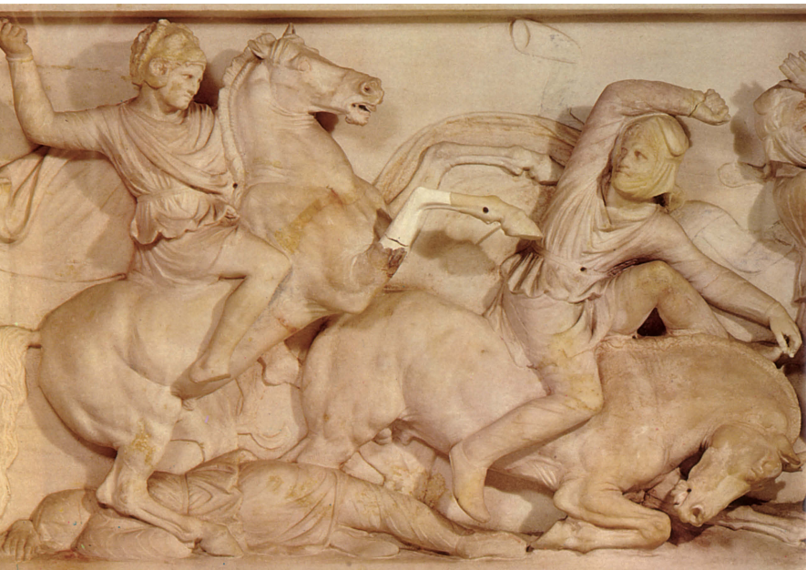
Szene aus dem Perserfeldzug Alexanders d. Gr. (Sarkophag-Relief, 4./3. Jh. v. Chr.)

Durch die Siege über die Perser stieg Athen zur Seemacht auf und gründete 478/477 v. Chr. den Attischen Seebund. Sein Ziel war zwar die endgültige Vertreibung der Perser aus dem ägäischen Raum, de facto wurde er aber zu einem politischen Instrument, mit dem Athen sich die Führung in Griechenland sicherte. Diese Politik führte konsequenterweise zum Konflikt mit den Spartanern und mündete im 1. Peloponnesischen Krieg (460–445 v. Chr.). Zunächst konnte Athen militärische Erfolge verzeichnen, sah sich aber – je länger, je mehr – zum Friedensschluss gezwungen. Die Kämpfe brachen allerdings 431 v. Chr. erneut aus und endeten 404 v. Chr. mit der Kapitulation der Athener. Zwar hatte Sparta gesiegt, doch war es zu geschwächt, um die