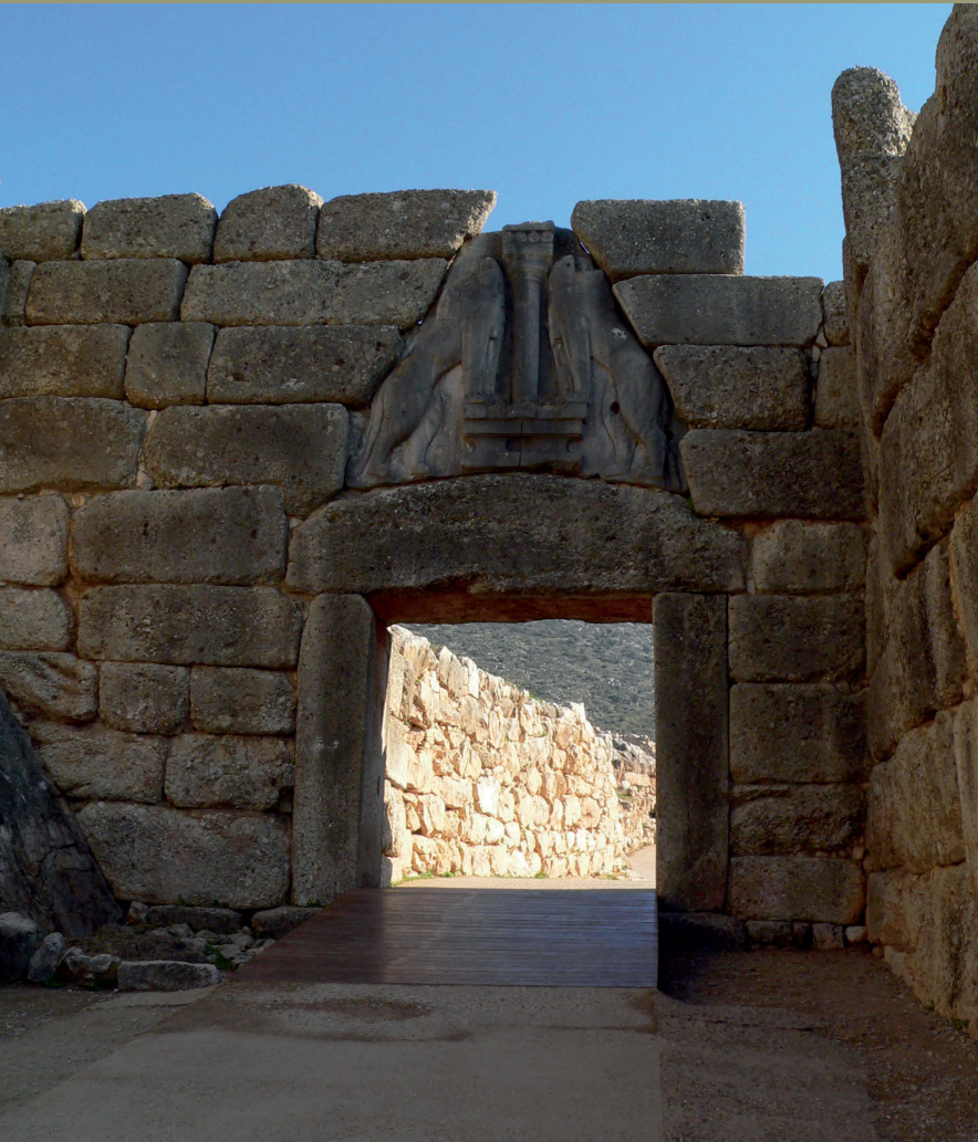
»Löwentor« in Mykene (13. Jh. v. Chr.)