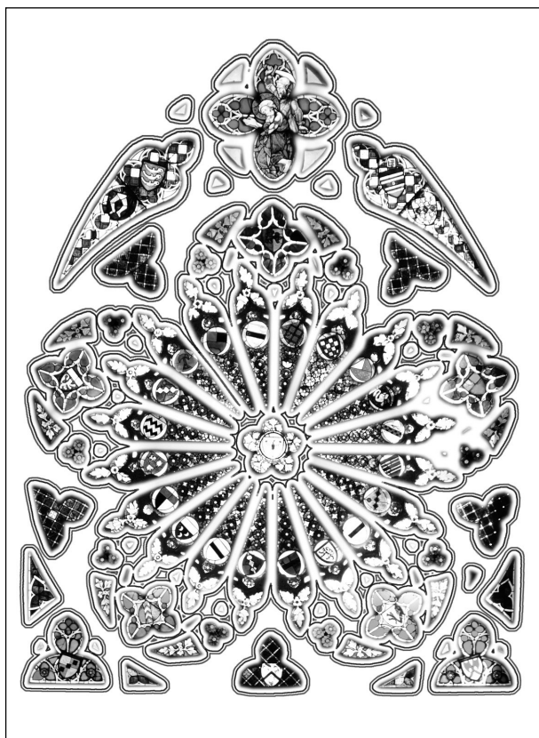
Die »Oppenheimer Rose«