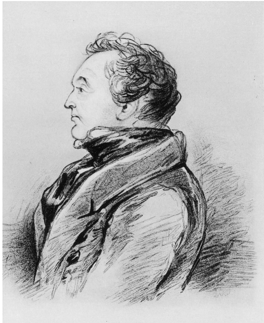
John Dickens (ca. 1845). Unbekannter Zeichner.

Barrow-Familie hielt allerdings nicht lange an. Schon ein Jahr nach der Eheschließung von John und Elizabeth musste Charles Barrow die Unterschlagung von Staatsgeldern zugeben, worauf er sich unter dem Vorwand, das Geld für die Rückzahlung beschaffen zu wollen, auf die Insel Man absetzte. Der Skandal hatte jedoch weder für John Dickens noch für Barrows eigenen Sohn berufliche Nachteile.