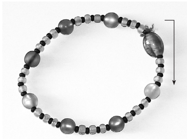
Die Farben der großen Perlen im Uhrzeigersinn: durchsichtig, gelb, grün, lila, blau, rot, orange, grau