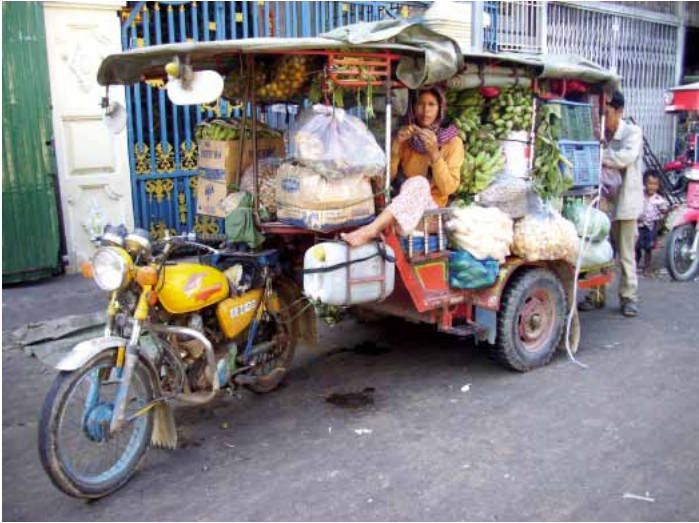
063ka Abb. 95

Die meisten Märkte sind von 7 bis 17 Uhr geöffnet, auch am Wochenende. Nur an den Feiertagen wie dem chinesischen oder kambodschanischen Neujahrstag schließen viele Händler ihre Läden für mehrere Tage. Gemüse, Fisch und Fleisch kaufen die Leute eher am Vormittag, da alles noch frisch ist und das Angebot viel breiter ist als am Nachmittag. Auf dem Markt und um die Märkte herum gibt es viele Wechselstuben. Wenn man nur Kleinigkeiten kaufen will wie z. B. ein wenig Gemüse, Bananen oder gekochte Speisen, ist es einfacher, mit dem kambodschanischen Riel zu bezahlen. Wenn man nicht genügend Khmer-Riel bei sich hat, kann man größere Summen auch in US-Dollar bezahlen. Dieser wird überall akzeptiert. Für den Einkauf auf dem Markt ist auf alle Fälle eine humorvolle kompetitive Verhandlungskunst hilfreich.