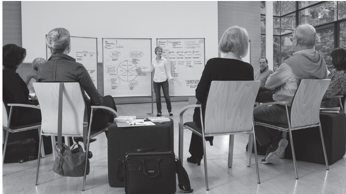
Abb. 2 – Arbeiten im „offenen Stuhlkreis“

Bei Gruppengesprächen in Form von Workshops sitzen die Teilnehmer in einem Halbkreis, der durch Medien wie Pinnwand und Flipchart und eventuell einem Touch-Monitor ergänzt wird. Das Zentrum bildet das so entstehende „Forum“.