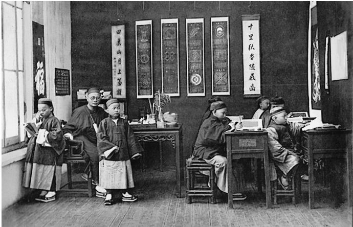
Unterricht in Kanton im ausgehenden 19. Jahrhundert. Die Aufnahme zeigt Schüler aus der begüterten Oberschicht mit ihrem Lehrer.