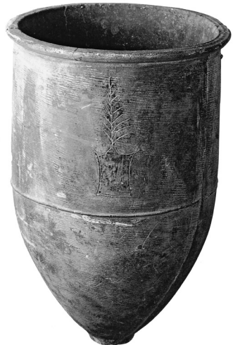
Tontopf mit eingeritztem Emblem aus Juxian (Shandong), 3. Jahrtausend v. Chr.

Nichts spricht hingegen für die syntaktisch korrekte Umset-