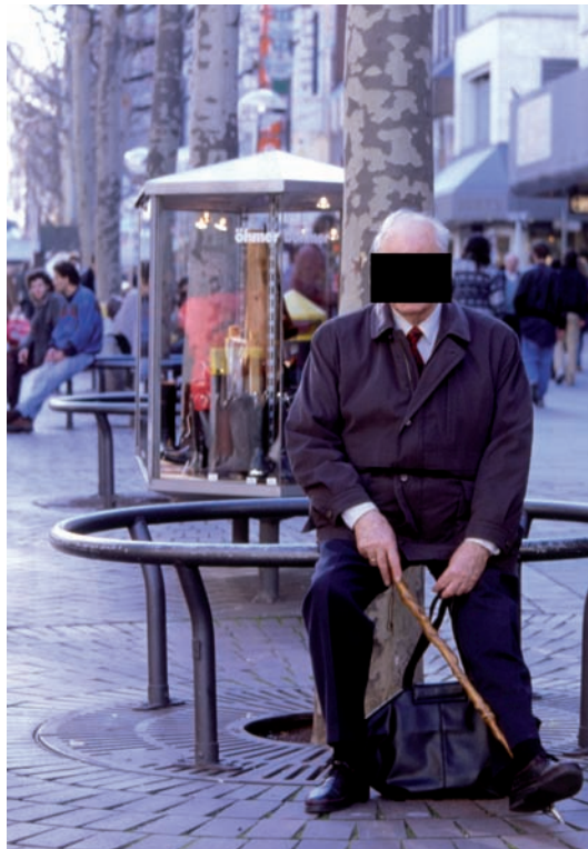
Könnte ein schönes Foto zum Thema Alter und Einsamkeit in der Großstadt sein, aber das Recht am eigenen Bild zwingt zur Anonymisierung der Person.

Die Reportage ist ein weites Feld der Fotografie. Sehen wir doch täglich frische Fotos in der morgendlichen Tageszeitung. Dieses Feld ist meist dem Freiberufler vorbehalten, der seine Bilder an die Presse oder Verlage verkauft oder komplette Reportagen zu einem Thema abliefert. Gerade in Deutschland muss man sich dabei mit allerlei gesetzlichen Regelungen befassen, die manche nicht ganz zu unrecht als Einschränkung der Pressefreiheit sehen. Die strenge Regelung von Bild- und Persönlichkeitsrechten (Recht am eigenen Bild) gibt es in anderen Ländern nicht in dieser Form. Hierbei wird unterschieden zwischen Privatpersonen und Personen der Zeitgeschichte, wobei Unterschiede gemacht werden zwischen „absoluten Personen der Zeitgeschichte“ und „relativen Personen der Zeitgeschichte“.