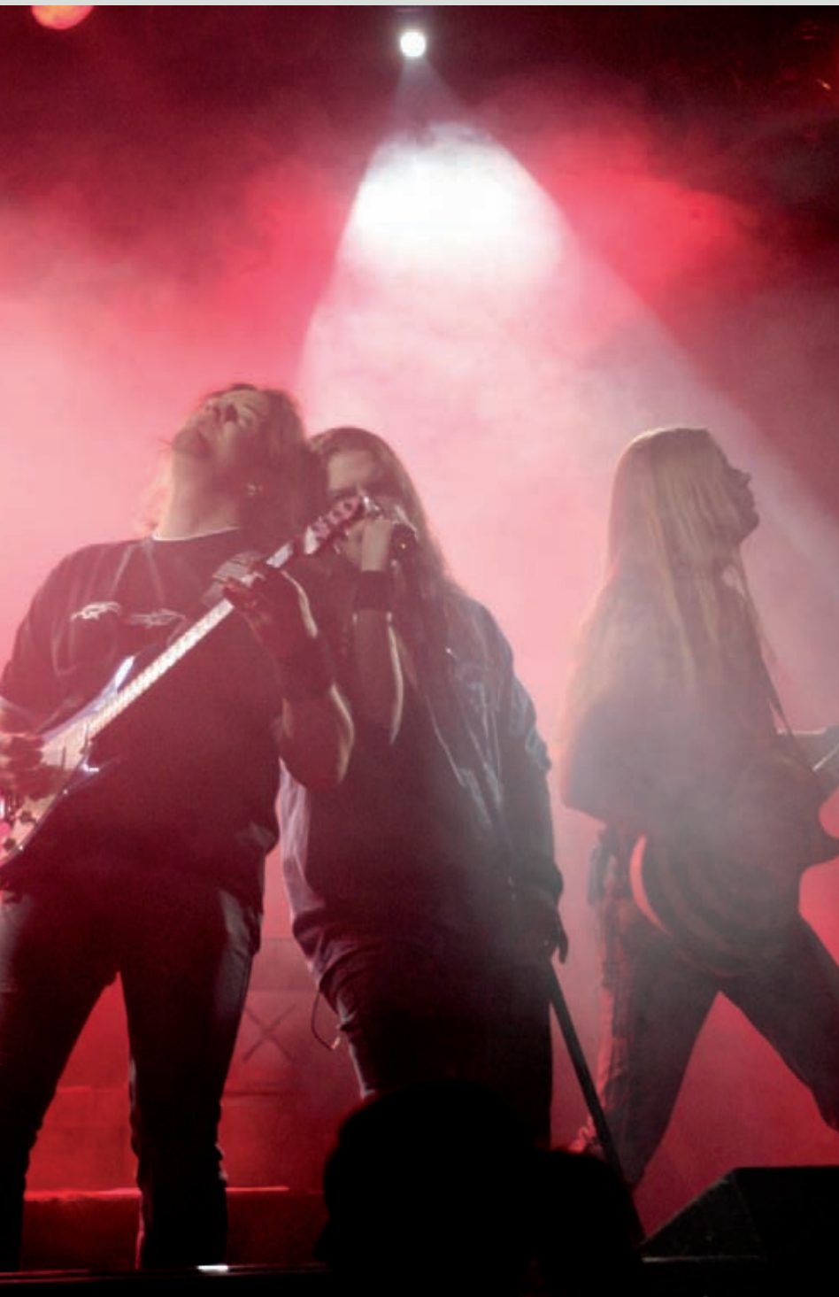
Ein vielseitiges Genre ist die Bühnenfotografie, denn Bewegung und wechselhaftes Licht sorgen für abwechslungsreiche Bilder.

Rechten der Bilder. Je nach Art und Größe der Veranstaltung werden schon mal lokale Pressefotografen zugelassen, wobei auch in diesem Fall genau geregelt wird, wie viele Fotos sie machen dürfen bzw. in welchem Zeitraum, z. B. die ersten vier Songs eines Konzerts.