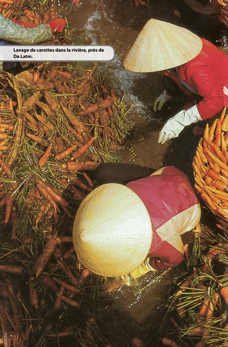
Lavage de carottes dans la rivière, près de Da Latm.