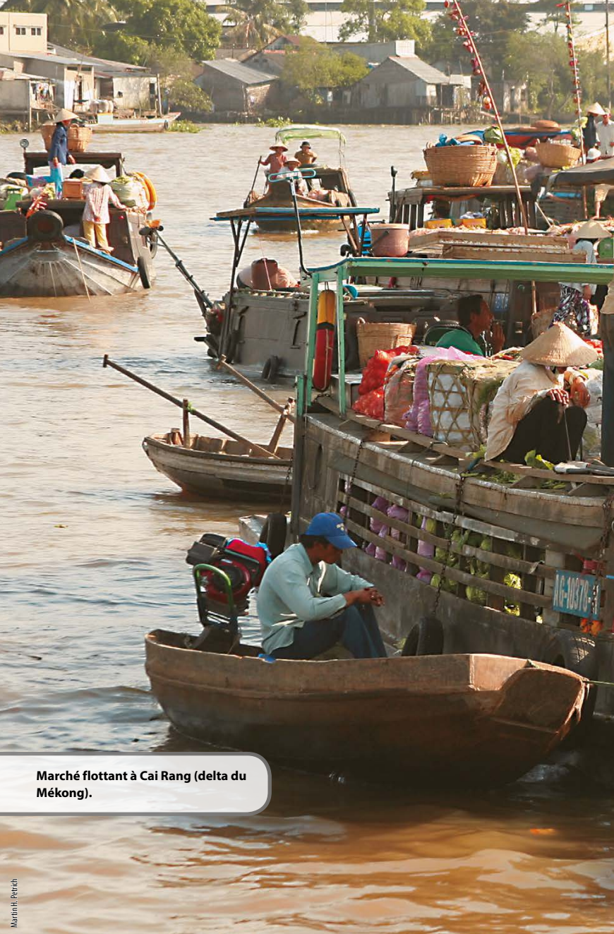
Marché flottant à Cai Rang (delta du Mékong).