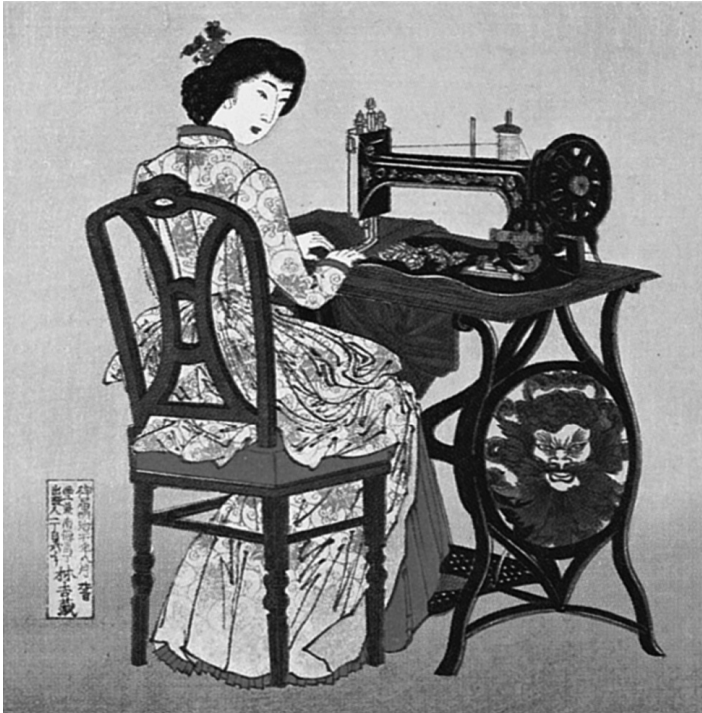
Abbildung 1: Einheitliche Kleidung: japanische Frau in einem westlichen Kleid vor einer Singer-Nähmaschine. Japanischer Druck des 19. Jahrhunderts.