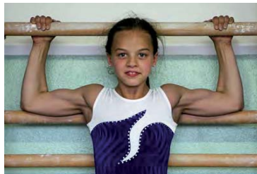
Abbildung 1: Turnerin, welche ein spezifisches Krafttraining absolviert hat (die Athletin war zur Zeit der Fotoaufnahme 12 Jahre alt)

Für und Wider zeigt das folgende Bild einer Turnerin, welche ein entsprechendes Krafttraining zusätzlich zum regulären Turntraining absolviert hat, dass es durch spezifische Krafttrainingsreize zu entsprechenden Anpassungsreaktionen kommen kann.