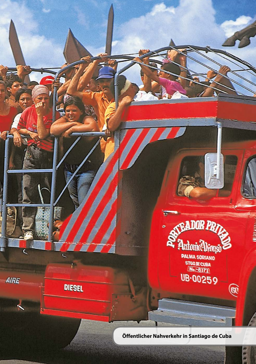
Öffentlicher Nahverkehr in Santiago de Cuba