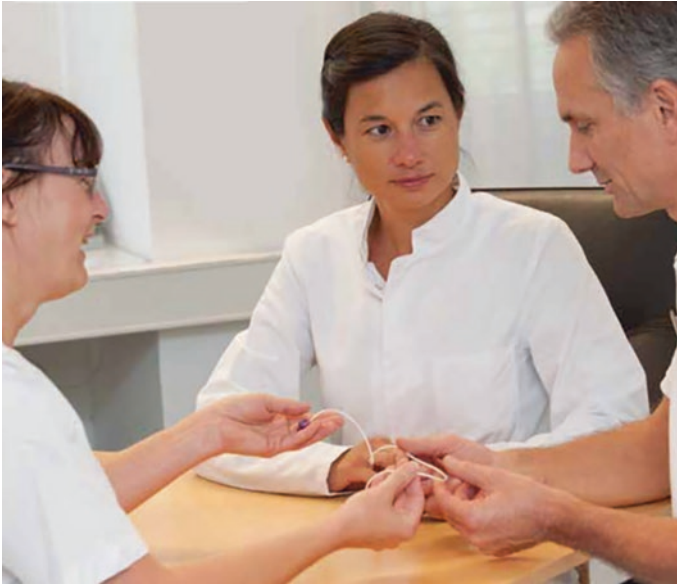
Abb. 1.1 Interdisziplinäre Zusammenarbeit. (Aus Universitätsklinikum Heidelberg, Port-Broschüre „Wissenswertes rund um Ihren Port“ 2014)

für die Behandlung des Patienten sind, jedoch weit weniger Schulung und spezifisches Fachwissen aufweisen, als dies bei ausgebildeten Pflegekräften bereits vorhanden ist und praktiziert wird. Es ist wichtig, diesen Mangel in der Standardisierung der Portpflege anzusprechen, weil sich gerade hier ausgesprochene Discrepanzen auf tun, die sich letztendlich zum Schaden des Portpatienten entwickeln können.