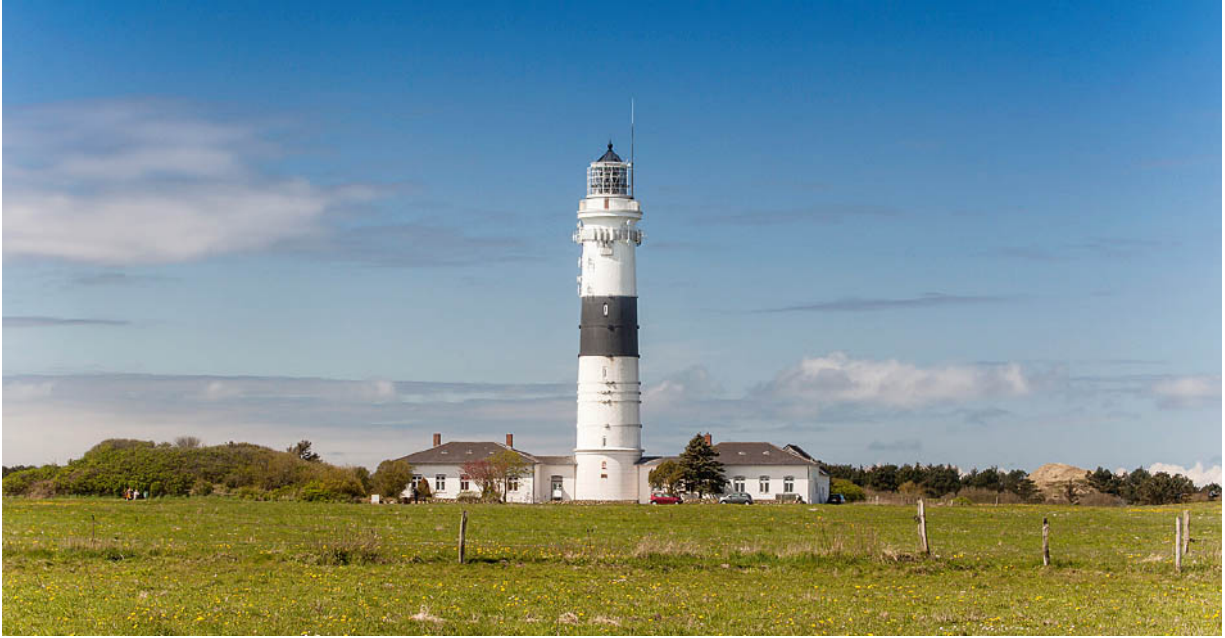
Postkarten-Leuchtturm Rotes Kliff bei Kampen, der Sylts Flair bestens bedient.