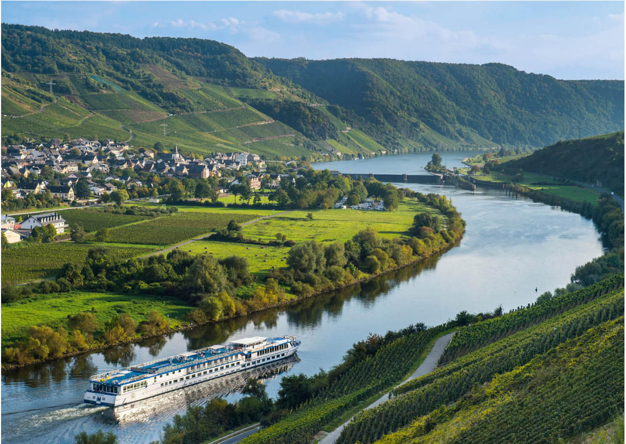
Gemütliche Flussschiffahrt auf der Mosel