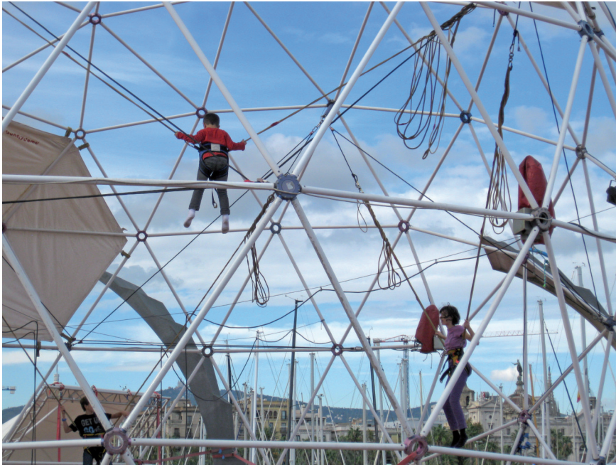
Abb. 1-3 Dynamische Vernetzungen von klein auf

Wir sollten allerdings im Auge behalten, dass selbstorganisierte Teams nicht nur eine Sache effektiver Zusammenarbeit sind. Heutzutage verlangen viele Wissensarbeiter nämlich selbst einen hohen Grad an Autonomie. Sie wollen selbstständig denken und handeln, statt bloß Instruktionen zu folgen. Und sie wollen lieber in Teams als alleine arbeiten. Schenkt man diversen Trendscouts Glauben, möchten die Millenials mit Spaß bei einer Sache sein, die für sie Sinn macht. Dazu gehört auch die Transparenz, inwiefern ihre Leistung zum Gesamterfolg des Unternehmens beiträgt. Hoch qualifizierte Wissensarbeiterinnen werden, so die Scouts, in Zukunft noch stärker auf Rahmenbedingungen achten, die gute Arbeit und ihre eigene Weiterentwicklung fördern. Und sie werden Unternehmen bevorzugen, deren Kultur zu ihrem Selbstwertgefühl passt [Viljakainen & Müller-Eberstein 2012].