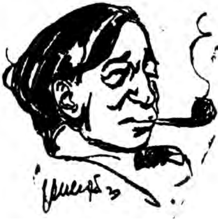
Abb. 1: Karikatur Siegfried Kracauers, in: Film-Kurier , 13.12.1930.

Am 12. Dezember 1930 erschien im Beiblatt des Berliner Film-Kuriers als sechster Beitrag in der Folge »Kritik ist schöpferische Kunst« ein Portrait des einflussreichsten Filmkritikers der Republik. 1