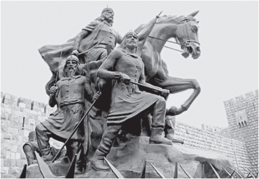
Abb. 1 Saladinstatue, Damaskus (Olfa Guizani)

pierenden Pferds, die andere packt den Krummsäbel, mit dem er entschlossenen Richtung Westen weist (Abb. 1). 1