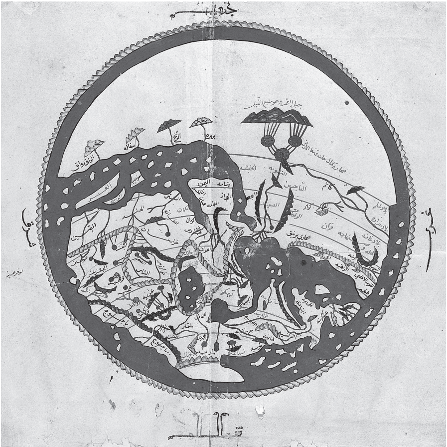
Abb. 2 Die nach Süden ausgerichtete Weltkarte von al-Idrisi, um 1154

findet sich in Manuskripten des marokkanischen Geografen al-Idrisi aus dem 12. Jahrhundert und wird daher meist ihm zugeschrieben. 3 Idrisi vollendete sein Werk geraume Zeit nach dem Beginn der Kreuzzüge (1154 im Auftrag des christlichen Königs von Sizilien, Roger II.). Dennoch und obwohl es eine bemerkenswert detaillierte Darstellung von Westeuropa und England (und sogar Irland) bietet, ist seine Weltsicht als solche ziemlich konventionell und kann der Einfachheit halber als Beispiel dafür dienen, wie Muslime vor den Kreuzzügen die Gestalt der Welt und den Platz ihrer Nachbarn darin sahen.