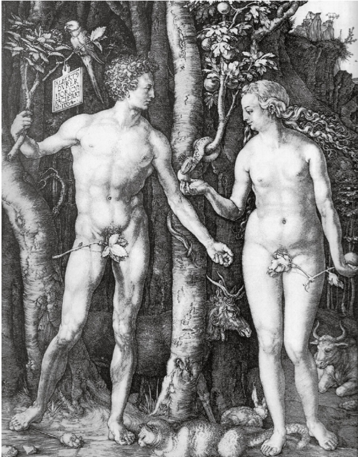
2: Adam und Eva / Der Sündenfall, 1504, Kupferstich