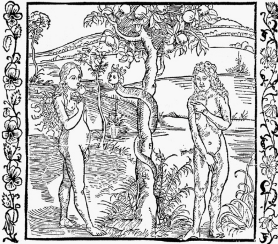
1: Adam und Eva / Der Sündenfall , 1493, Holzschnitt

Das zeigt sich – wie im Folgenden ausführlich dargelegt wird – bei den einzelnen Werken unterschiedlich konkret in entscheidenden, aber auch in weniger bedeutenden szenischen Aspekten der Bilder. Es zeigt sich in den fragwürdigen, nicht eindeutig zu deutenden Blicken und Gesten sowohl Evas, die immer als Handelnde auftritt, als auch Adams, der – außer auf der Zeichnung von 1510 – nur durch seine Gebärden präsent ist. Was auf Dürers Adam- und-Eva-Bildern zu sehen ist, sind angehaltene Aktivitäten, Momentaufnahmen, erfasste Augenblicke. Auch sie sind „Stilleben“. Da es sich bei den Gesten um stillgestellte, bildlich fixierte Aktionen handelt, kann oft nur – mal mehr, mal weniger, mal nicht überzeugend begründet – gesagt werden, wie die einzelnen Aktionen in einem narrativen Kontext zu sehen, zu beschreiben und wie sie dann