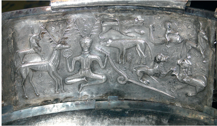
Abb. 1.5: Der Kessel von Gundestrup

Der handwerklich hervorragend gestaltete Kessel wurde vermutlich von thrakischen Künstlern im Auftrag eines keltischen Fürsten hergestellt. Die Abbildung zeigt eine der Schmuckplatten des Kessels, auf der im Zentrum die Figur eines sitzenden Mannes zu sehen ist, der auf dem Kopf ein Geweih trägt und in den Händen einen Ring und eine Schlange hält. Dabei kann es sich um den keltischen Gott Cernunnos (der Name ist latinisiert, der eigentliche Name des Gottes ist nicht bekannt) handeln, der für die Natur insgesamt, die Tierwelt und die Fruchtbarkeit stand; nach einer anderen Interpretation ist ein Schamane dargestellt. Dafür spricht neben den Kopfschmuck auch die rituelle Körperhaltung, die auf die Vorbereitung einer „schamanischen Seelenreise“ hinweist.