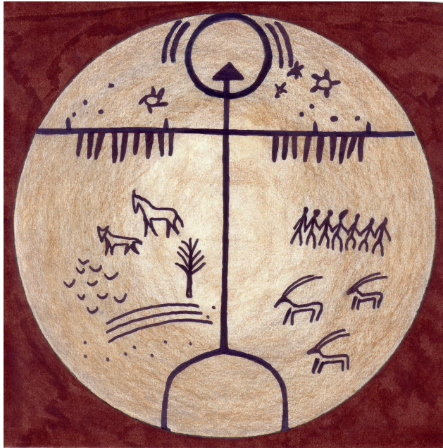
Abb. I.3: Schamanentrommel Die Darstellung zeigt die „Drei-Welten-Kosmologie“ des Schamanismus.

Die Trommel des Schamanen ist von zentraler Bedeutung.