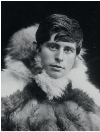
Abb. I.4: Knud Rasmussen (undatierte Photographie, ca. 1900)

Wie sehr das Wirken des Schamanen in das tägliche Leben eingreift, erhellt aus den Erklärungen, die ein Inuit vom Stamm der Iglulik dem selbst aus Grönland stammenden dänischen Polarforscher und Völkerkundler Knud Rasmussen (1879–1933) hinsichtlich der Ernährung gab: