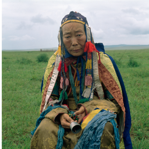
Abb. I.2: Schamanenkostüm der sibirischen Ewenken. Das Kostüm ist aus Rentierfell gemacht, dem heiligen Tier der Ewenken.

Eine einheitliche Schamanentracht gibt es nicht. Allerdings treten Bänder, Metallstücke und Vogelfedern häufig auf. Das Metall hat einen apotropäischen (dämonenabwehrenden) Sinn und steht vermutlich in einem Zusammenhang mit der oben erläuterten Feuermagie der Schmiede. Das wichtigste schamanische Tier ist der Vogel, denn er symbolisiert den Flug des Schamanen. Legt ein Schamane seine Tracht an, verwandelt er sich in sein Leittier.