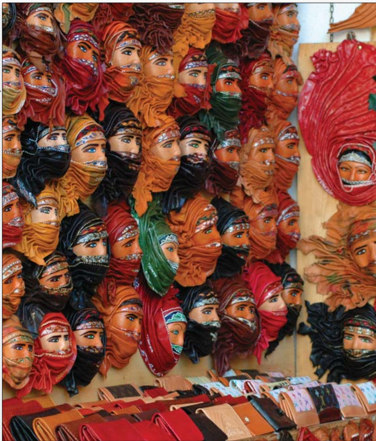
Maskengeschäft in Tunis