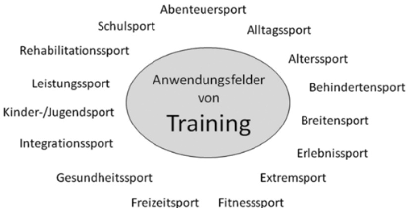
Abb. 1/1.1: Anwendungsfelder des sportlichen Trainings

Ableitend von dieser allgemeinen Definition, wird klar, dass das körperliche Training für alle Populationen (Kinder, Jugendliche, Berufstätige, Ältere) offen sein muss und nicht nur der Leistungsentwicklung dient, sondern auch der Prävention und Rehabilitation. Durch den Sport werden auch erzieherische Ziele unterstützt. Dazu gehören Fairness, Kommunikation, Sozialverhalten, Durchsetzungsvermögen u. a. Durch Sport wird die Lebensqualität gesteigert, die Gesundheit erhalten, das Lebensalter erhöht und Risikofaktoren vermindert. Die Anwendungsfelder des Trainings sind daher vielfältig und betreffen alle Altersgruppen. Durch die unterschiedliche Interessenslage gehen die Motive zur sportlichen Betätigung weit auseinander und erweitern die Vorstellungen zum Leistungssport bedeutend (Abb. 1/1.1).