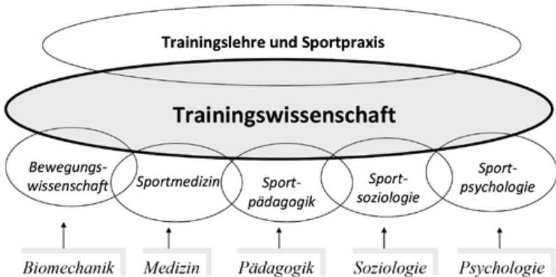
Abb. 2/1.1: Trainingswissenschaft als interdisziplinärer und integrative Wissenschaft zwischen Trainingslehre und Sportpraxis, den Disziplinen der Sportwissenschaft und ausgewählten Basiswissenschaften