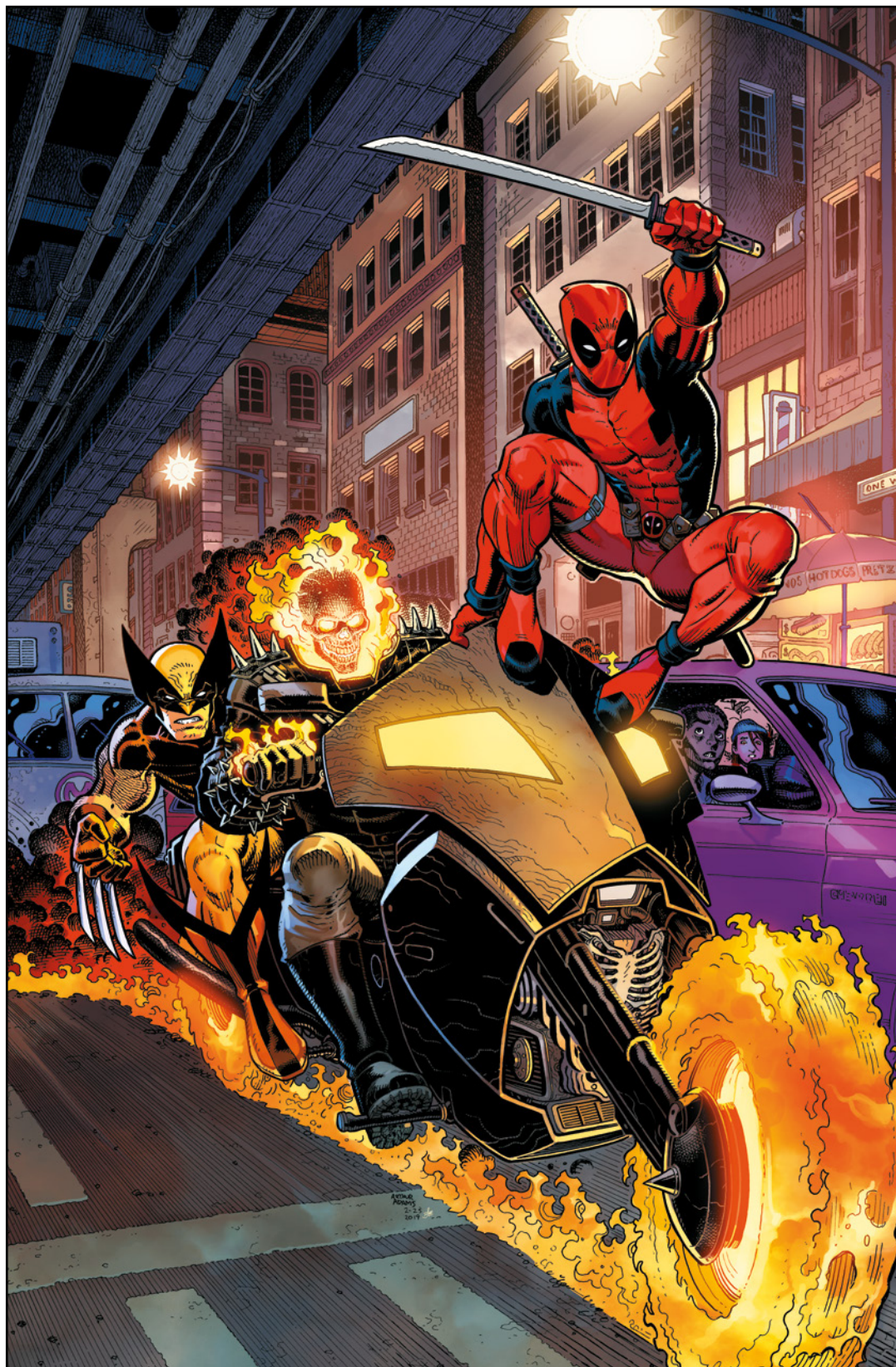
Marvel Comics Presents (2019) 6 (III) Cover von ART ADAMS